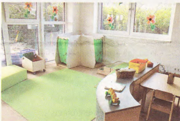
Die Krippengruppe hat eine neue Einrichtung und neue Spielzeuge bekommen.

zu gewährleisten wurden auch die Nebenräume des Bestandsgebäudes im Zuge der Arbeiten aufgefrischt. Der Erweiterungsbau ist ein Schmuckstück geworden, dass nicht nur die kleinen Sylter sondern auch Eltern, Großeltern, Geschwister, Erzieher und alle Beteiligten strahlen lässt.