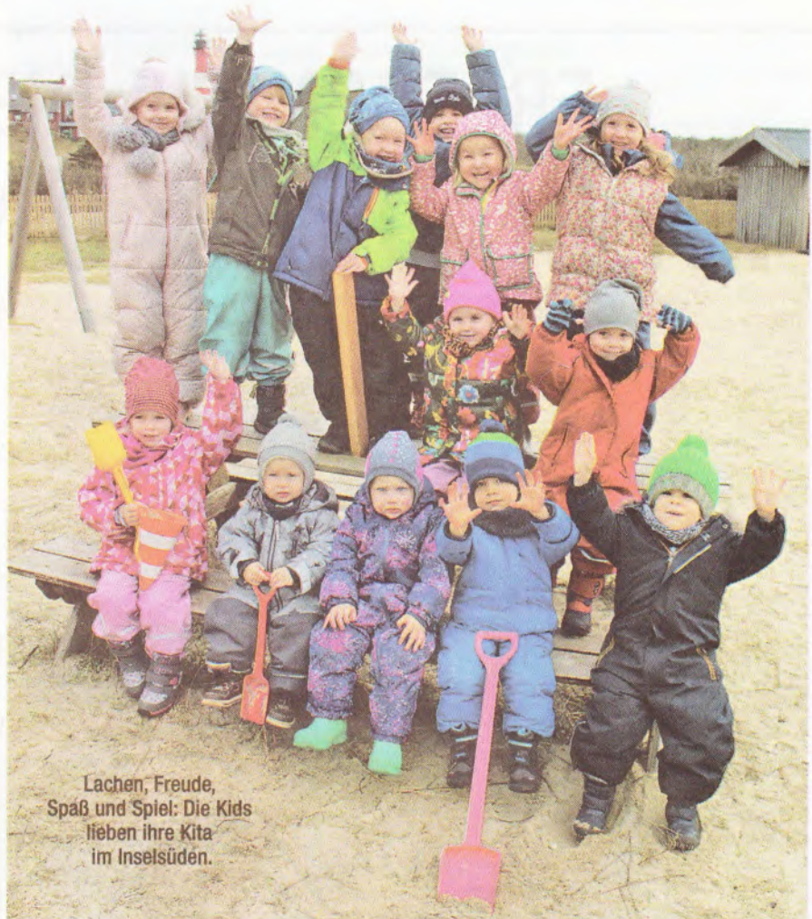
Lachen, Freude, Spaß und Spiel: Die Kids lieben ihre Kita im Inself Süden.