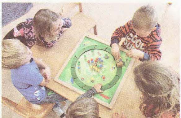
Mit den verschiedensten Gesellschaftsspielen lernen die Knirpse ihre Kreativität einzusetzen, Gemeinschaftssinn und logisches Denken.