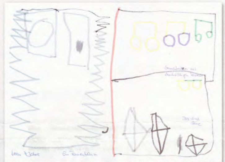
Bald, Kinder, wird es was geben, bald wird sich Leon (4) freuen.