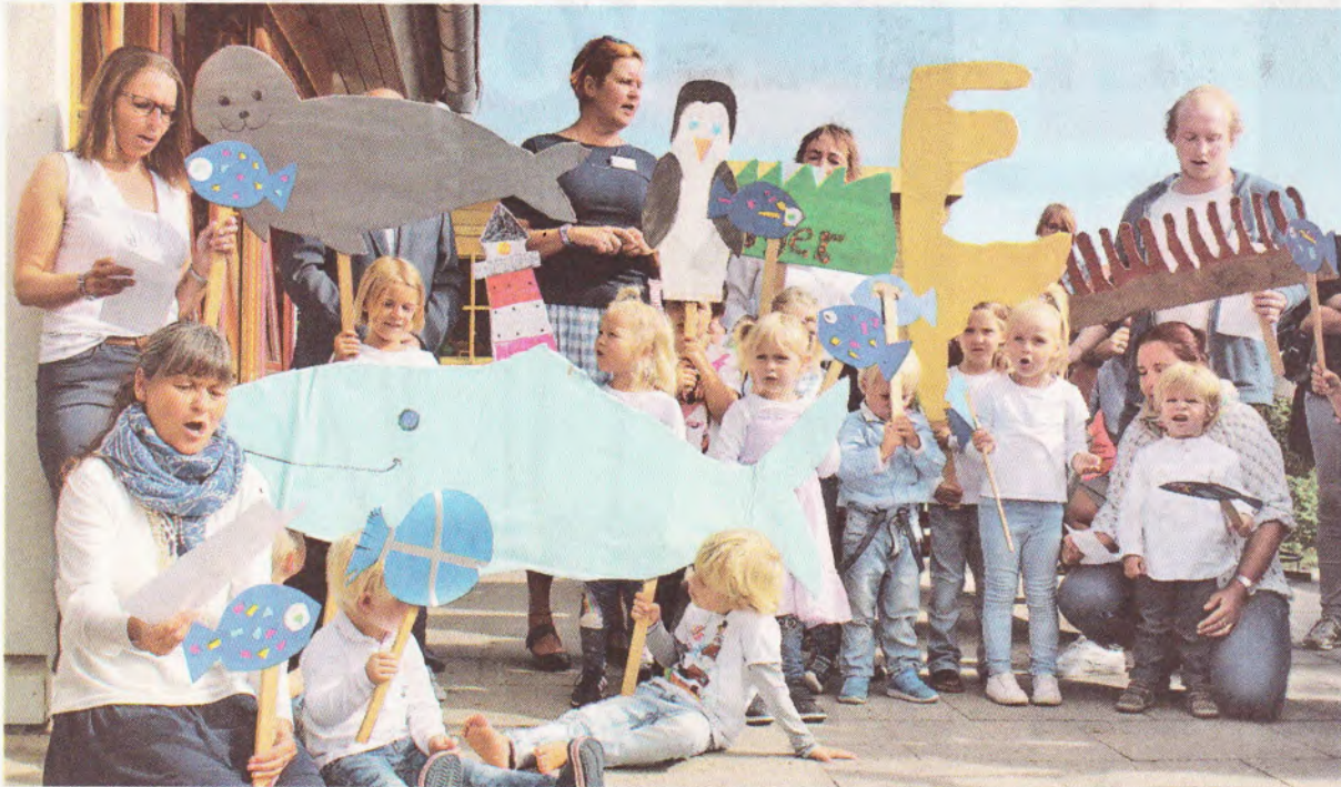
Die Kita-Kinder erfreuten die zahlreichen Gäste mit einer kleinen musikalischen Darbietung bei den Feierlichkeiten.

Es war ein besonderer Tag im Inselfüden: Strahlender Sonnenschein, lachende Kinder, glückliche Eltern und Gäste bei der offiziellen Einweihung des Erweiterungsbaus des ADS-Kindergartens Hörnum/Rantum anlässlich des Weltkindertags am 20. September. Im Odde Wai 2 in Hörnum wurde viele Monate