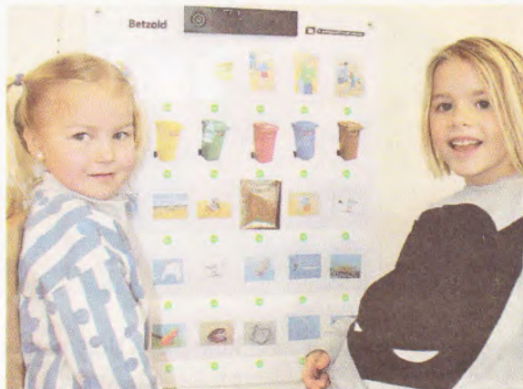
Mit der friesischen Sprachwand macht die Hörnumner Kita beim C.P. Hansen-Jugendpreis mit.