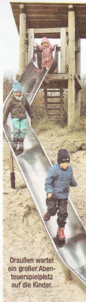
Draußen wartet ein großer Abenteuerspielplatz auf die Kinder.

Strand spazieren und haben viel Müll gesammelt. Frische Luft und viele Aktivitäten draußen werden hier groß geschrieben. Aufgrund der besonderen Lage in Hörnum stehen oft Stranderkundungstouren, Spaziergänge und Beobachtungsausflüge mit Ferngläsern auf dem Programm. Echtes Tages-Highlight für die Ein- bis Sechsjährigen ist der Außenbereich mit dem Spielplatz: Von hier aus kann man nicht nur den Hörnum Leuchtturm sehen, sondern richtige Abenteuer erleben. Bagger, Eimer, Schaufeln und Bälle werden aus dem Schuppen geholt, die Rutsche erobert oder die Schaukel kurzerhand in ein Schiff umgewandelt. Für genügend Energie sorgt der Kindergarten mit Frühstück und einem warmen Mittagessen, die täglich frisch in der Einrichtung zubereitet werden. Nach einem Tag im ADS-Kindergarten Hörnum/Rantum möchte man doch selbst wieder Kind sein. Und wer sich selbst ein Bild von dieser tollen Einrichtung machen möchte, der sollte den Tag der offenen Tür im Zusammenhang mit dem Kleidermarkt am 29. Februar von 10 bis 16 Uhr besuchen.