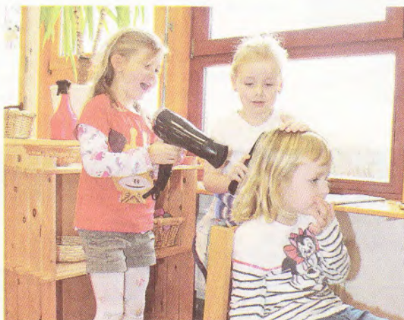
Die Mädchen lieben ihre Frisiercke, in der sie sich gegenseitig schöne Haare zaubern.