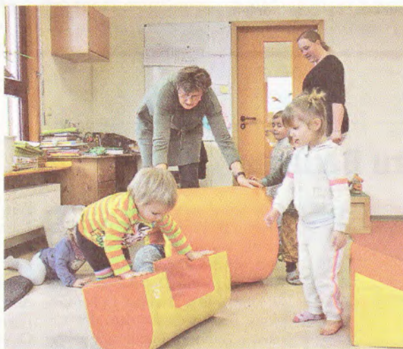
Sportliches Turnen gehört zum Alltag der Kinder.